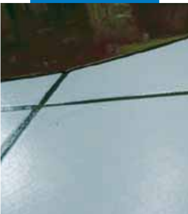
Деталь применения Ultraplan на старом керамическом полу после предварительной обработки составом Maprim SP