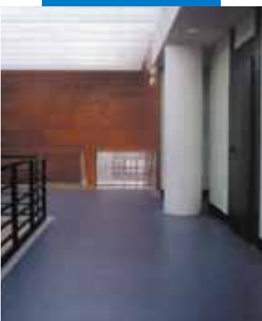
Пример укладки линолеумного покрытия поверх выравнивающей массы Ultraplan - Консерватория Монсон - Испания