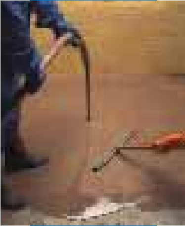
Нанесение Ultraplan насосом с последующей обработкой скребком

Нанесение слоя Ultraplan готовит поверхности для укладки упругих, текстильных, керамических и деревянных половых покрытий, которые могут быть приклеены по прохождении 12 при температуре при +23°C (это время может