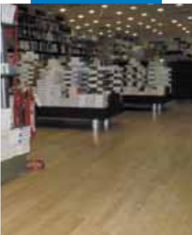
Пример укладки дерева поверх выравнивающей массы Ultraplan Музыкальный магазин "Мессаджерие Музикали" - Рим - Италия